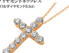
ダイヤモンドネックレス (K18/ダイヤモンド0.5ct)