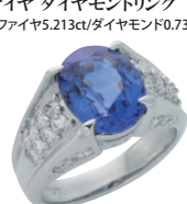
サファイヤ ダイヤモンドリング (PT/サファイヤ5.213ct/ダイヤモンド0.735ct)