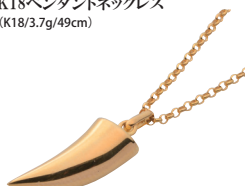
K18ペンダントネックレス (K18/3.7g/49cm)