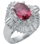
ルビー ダイヤモンドリング (PT/2.68ct 1.65ct)