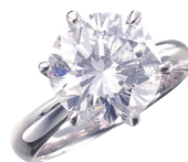
ダイヤモンドリング (PT/5.035ct G SI2 VG)