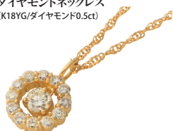
ダイヤモンドネックレス (K18YG/ダイヤモンド0.5ct)