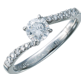
ダイヤモンドリング (PT/ダイヤモンド0.516ct 0.16ct H WVS2 F/12号)