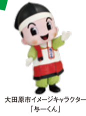
大田原市イメージキャラクター「与ーくん」